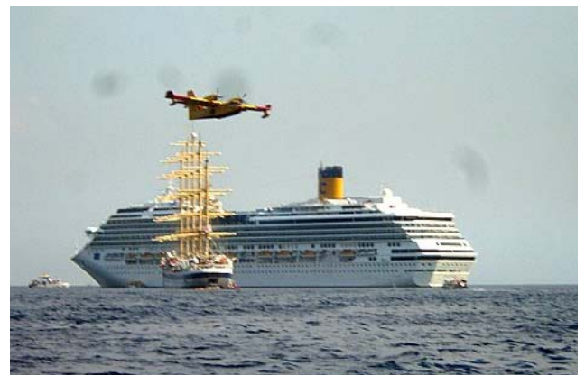
Löschflugzeug nimmt Wasser vor dem Hafen auf

Nachts sind die vom Wind neu entfachten Feuerlinien der Waldbrände an verschieenen Hängen gut zu sehen – ein gespenstisches Bild.