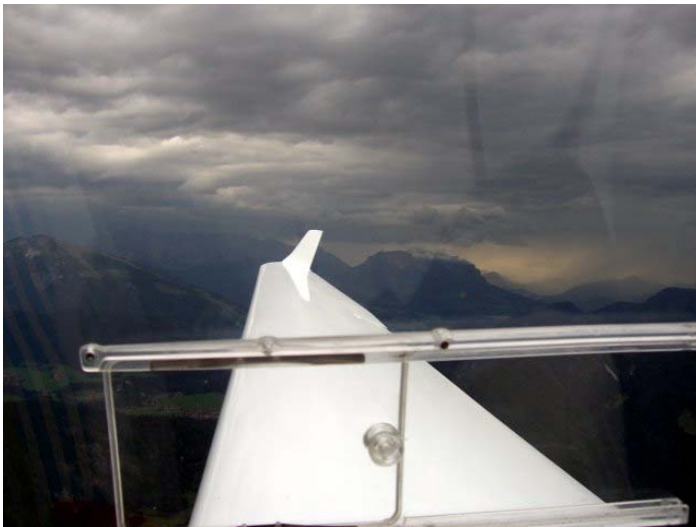
Abflug Unterwössen - Kaisergebirge

Nach ca 50 km kommen wir schon wieder in die Sonne, und der Kurs führt uns non-stop über den Katschbergpass, die Meldepunkte Confine/Border, Riften, und weiter nach Triest.