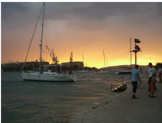
Böenwalze im Hafen von Trogir

Ein Linienbus sollte direkt auf der Landstrasse vor dem Terminal nach Trogir fahren. Wir versuchen unser Glück, und nach wenigen Minuten sind wir tatsächlich unterwegs. Am Busbahnhof in Trogir angekommen sind es nur wenige Meter über eine Steinbrücke zur auf einer Insel gelegenen Altstadt. Seit 1997 ist Trogir UNESCO Welterbe, in der Altstadt sind keine Fahrzeuge zugelassen. In der Zimmervermittlung haben wir schnell eine Privatunterkunft gesichert. Der Weg durch die engen Gassen wird sich abends noch als tückisch erweisen. Aber nach dem ‚Einchecken‘ geht es erstmal auf der anderen Seite der Altstadt über eine Zugbrücke auf die Insel Ciovo an einen Felsstrand zum Baden.