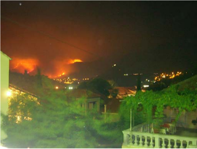
Waldbrand bei Cavtat

Schon beim Start haben wir bis zu 20kt Crosswind und sind froh über unser gutmütiges Bugfahrwerk. Die Route führt uns zunächst zurück über Polace und Korcula und dann weiter entlang der Adria Route 4 über Sinj bis Knin, und weiter direkt nach Otocac.