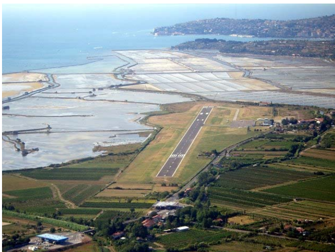
RWY33 Portoroz, im Hintergrund Piran

Nach 1 Stunde 52 Minuten Flugzeit landen wir in Portoroz.