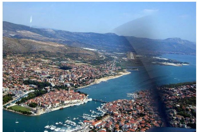
Anflug über Trogir, im Hintergrund Split RWY05

Am nächsten morgen sagt der Blick aus dem Fenster nichts Gutes vorher: die Kaltfront ist nachts über die Alpen gewandert und hat Istrien erreicht. Bei einer Tasse Kaffee prüfen wir das Wetter mit dem PDA, weiter im Süden schaut es zunehmend besser aus. Wir werden wieder versuchen, das sonnige Wetter zu erreichen. Also geht es zurück zum Flugplatz, und nach Flugplanaufgabe starten wir bei leichtem Regen nach Süden an der istrischen Küste entlang. Die in den NOTAMs erwähnten Waldbrände in Kroatien sollen kein Problem darstellen. Gleich nach dem Start fliegen wir in den kroatischen Luftraum ein.