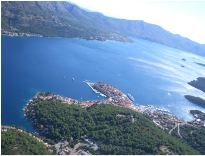
Entlang der VFR Route Adria 1

Später queren wir die Halbinsel zur Kvarner Bucht, erreichen wieder bestes Wetter und fliegen in 1.500 ft entlang der Adria Route 1 über die Inseln Cres, Rab und Pag, vorbei an Zadar. 2:10h später erreichen wir Split.