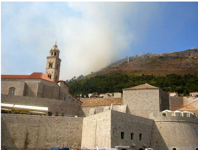
Waldbrand über Dubrovnik

Es gibt eine Zimmervermittlung direkt an der Abzweigung, die uns auch per Auto zur Unterkunft bringt. Wir legen kurz unsere Sachen ab, und gehen zu Fuß zum Strand um ein paar Stunden zu baden. Das Örtchen scheint sich zum Geheimtreff der Großyachten entwickelt zu haben, an der Mole liegen etliche Yachten mit 50m Länge und mehr.